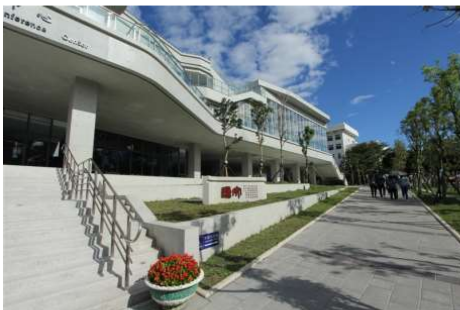
淡江大學守謙國際會議中心 (TKU Hsu Shou-Chlien International Conference Center)